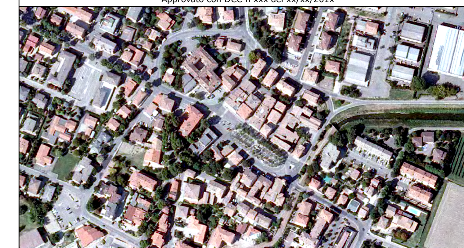
QC.02.2 RISCHIO IDRAULICO