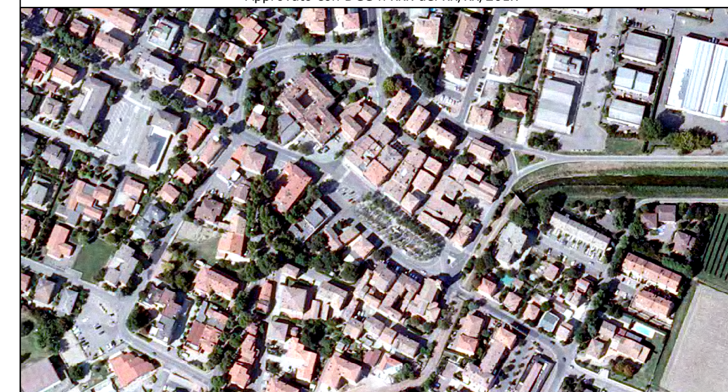
QC.03.2 TUTELE PAESAGGISTICHE E STORICO CULTURALE Scala 1:5.000

Assistito con DCC n. xxx del xx/xx/201x Approvato con DCC n. xxx del xx/xx/201x