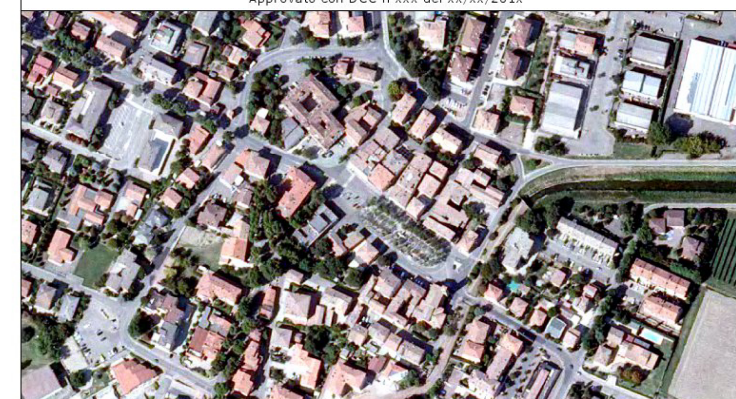
QC.04.1.4 RETI - GAS