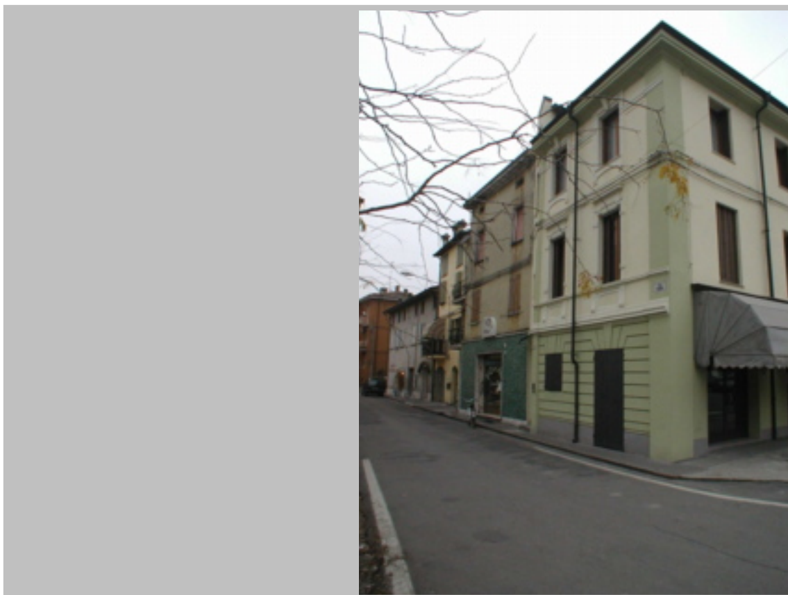
Prospetto principale su Via della Pace